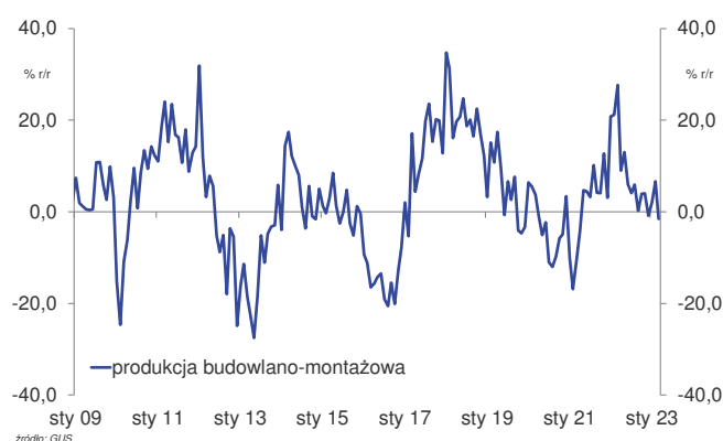
Dynamika produkcji budowlano-montażowej